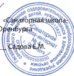
График входа обучающихся ГКООУ «Санаторная школа-интернат №4» г. Оренбурга на 1 полугодие 2020/21 учебного года (в день начала занятий)