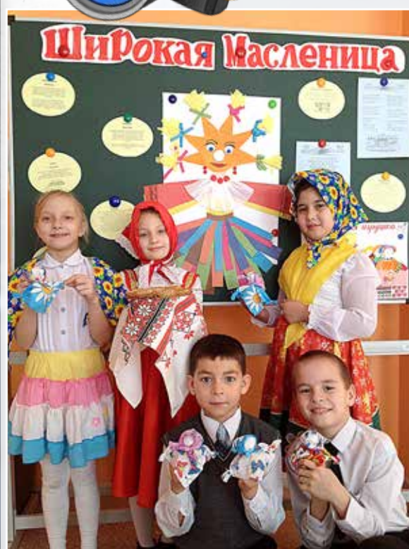
3. Вкусные традиции, 2АБ класс.

Не знаете, как празднуют Масленицу? Приходите! Расскажем и блинами угостим.