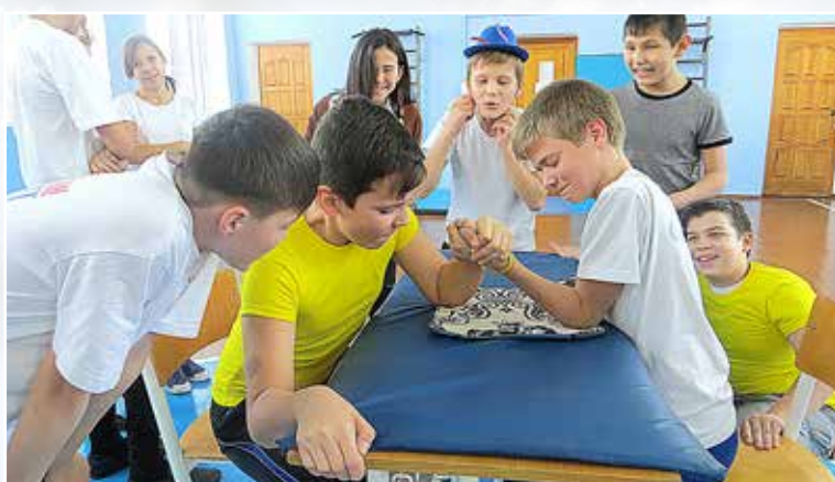
2. Честный поединок, 6А, 6Б классы.

На уроках биологии можно не только прочитать про живую природу, но и руками ее потрогать!