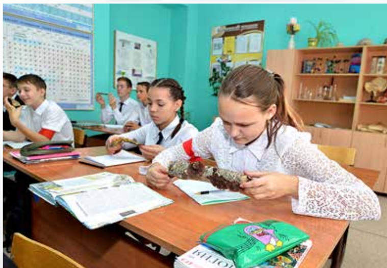
1. Чудо природы, 7АБ класс.

На уроках биологии можно не только прочитать про живую природу, но и руками ее потрогать!